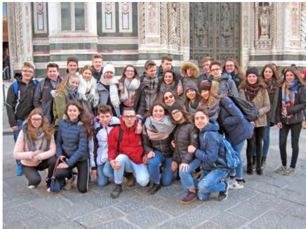
Die Teilnehmer am Austausch 2018 mit ihren Austauschpartnern vor dem Dom von Florenz