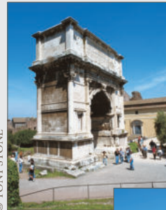
Titusbogen, Rom, 81 n. Chr.

Wenn du die drei Bauwerke betrachtest, erkennst du leicht ihre Gemeinsamkeiten, obwohl ihre Bauzeit fast 2000 Jahre auseinanderliegt.